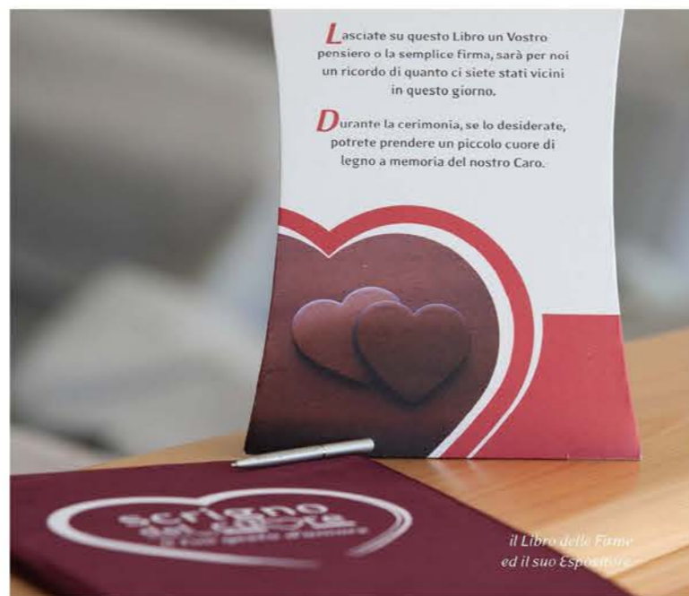
il Libro delle Firme ed il suo Espositore.

I Libretti "Il nuovo Rito di Commiato" e le minipenne, entrambi personalizzabili con il nome dell'Impresa, vanno sistemati sui banchi della Chiesa per una più agevole distribuzione ai partecipanti alla Cerimonia. Aiutano l'impresario a spiegare l'emozionante rito di Scigno del Cuore.