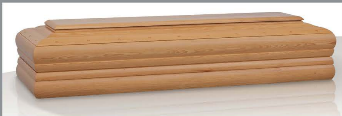
MOD. AURORA - VERSIONE RETTA