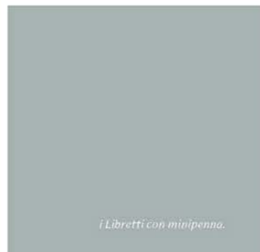
I Libretti con minipenna.