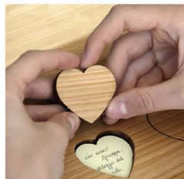
I Cuori di Caroncino.

La cerimonia di Scigno del Cuore è innovativa ed emozionante: la sua particolarità consente ai partecipanti di provare l'emozione unica del dono e del ricordo tangibile da custodire per sempre.