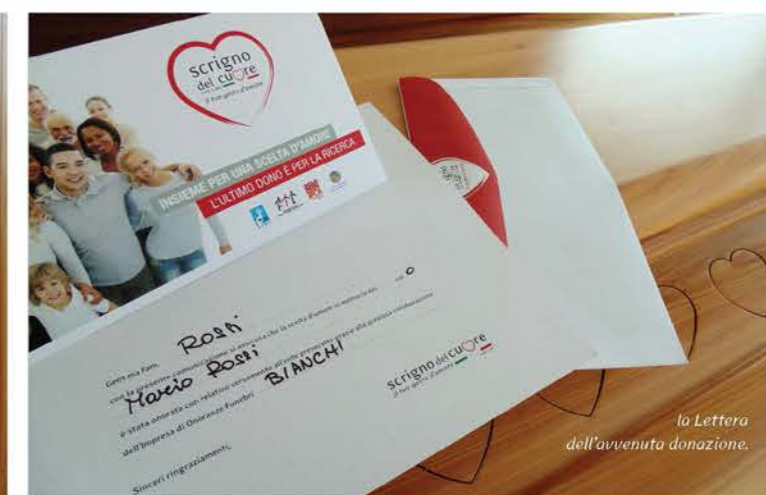
la Lettera dell'avvenuta donazione.