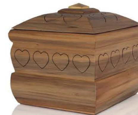
Urna in Noce Extra finitura satinata

Il progetto di solidarietà in favore di istituti in prima linea nella ricerca scientifica è chiaramente previsto anche per le Urne di Scigno del Cuore.