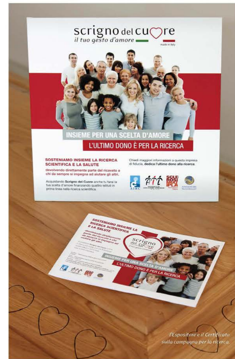
l'Espositore e il Certificato sulla campagna per la ricerca.

www.scignodelcuore.com informazioni 337.66.16.34