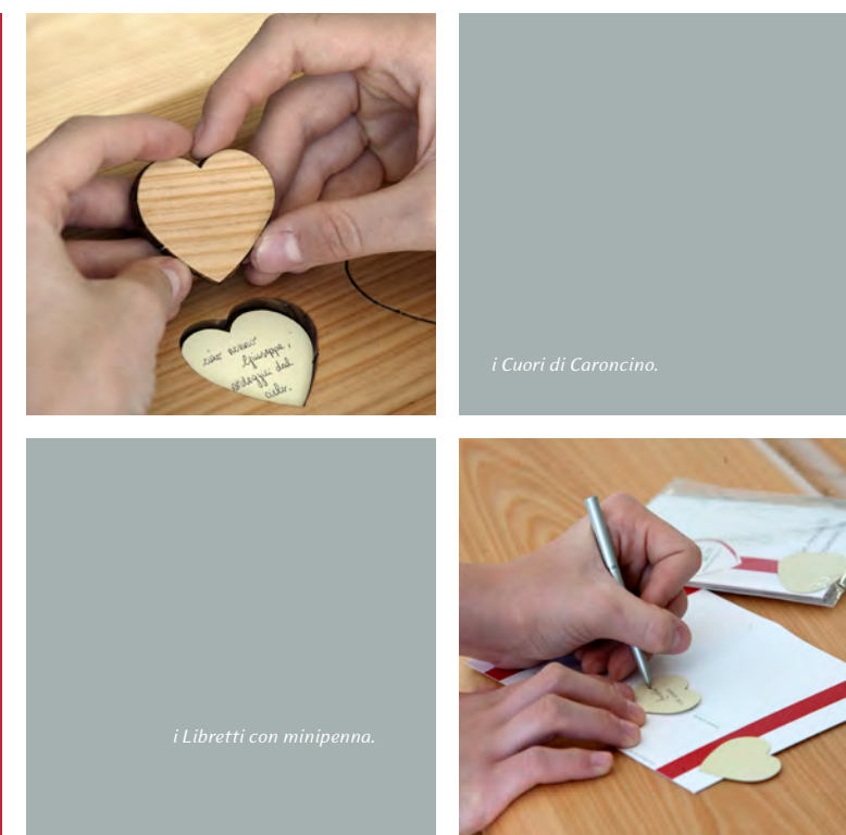
i Cuori di Caroncino.

La cerimonia di Scigno del Cuore è innovativa ed emozionante: la sua particolarità consente ai partecipanti di provare l'emozione unica del dono e del ricordo tangibile da custodire per sempre.