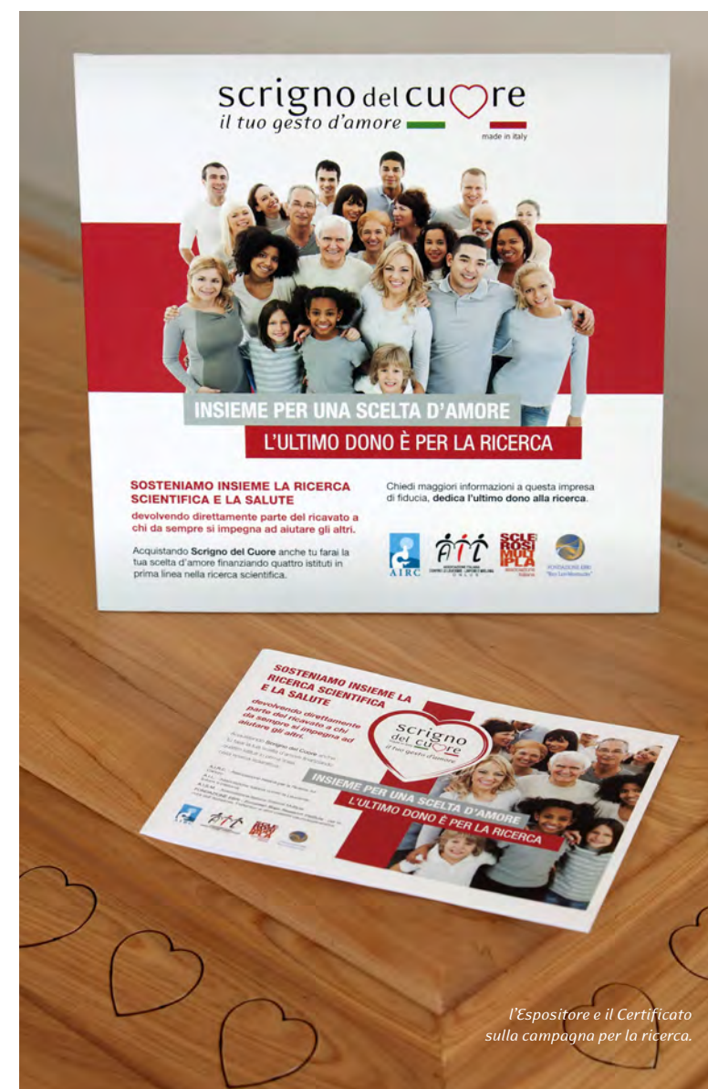
l'Espositore e il Certificato sulla campagna per la ricerca.

www.scignodelcuore.com informazioni 337.66.16.34