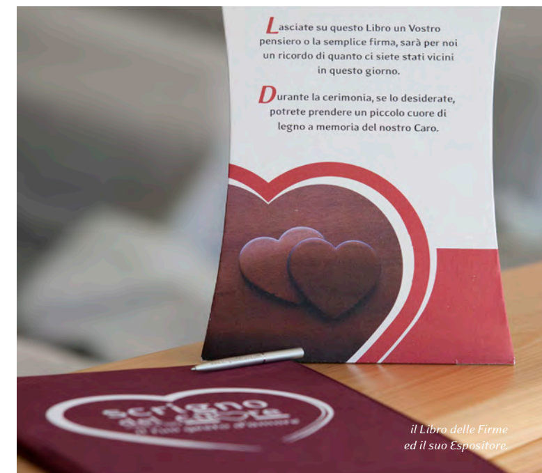
il Libro delle Firme ed il suo Espositore.

www.scignodelcuore.com informazioni 337.66.16.34