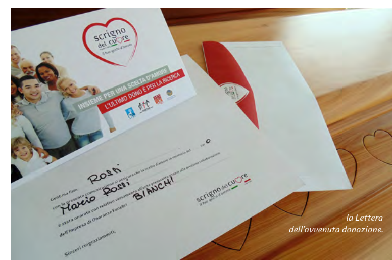
la Lettera dell'avvenuta donazione.