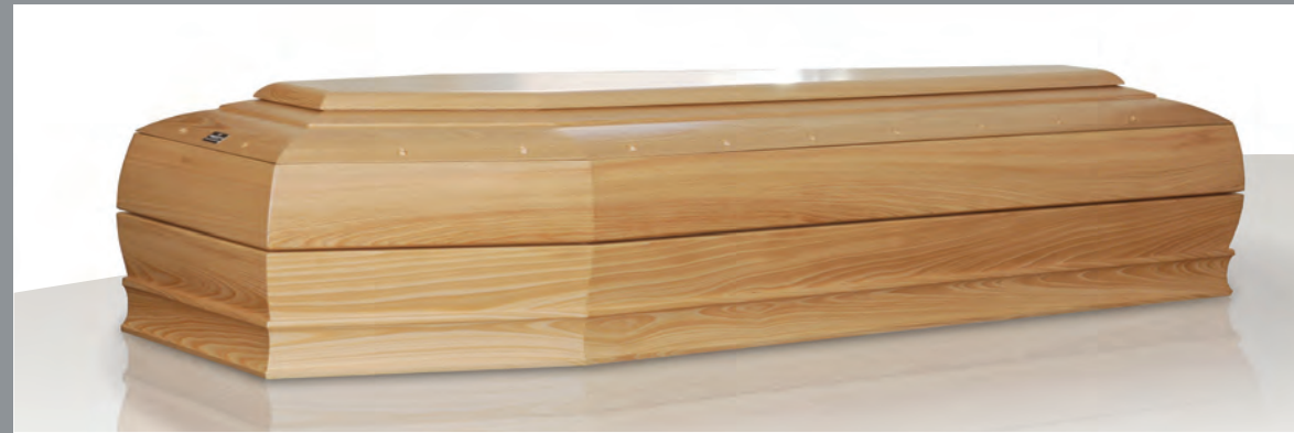
MOD. GEMMA Il legno divino

Radici nella storia e nell'eredità del grande artigianato e sguardo rivolto alla contemporaneità del design.