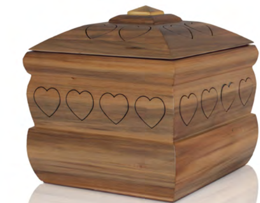
Urna in Noce Extra finitura satinata

Il progetto di solidarietà in favore di istituti in prima linea nella ricerca scientifica è chiaramente previsto anche per le Urne di Scigno del Cuore.