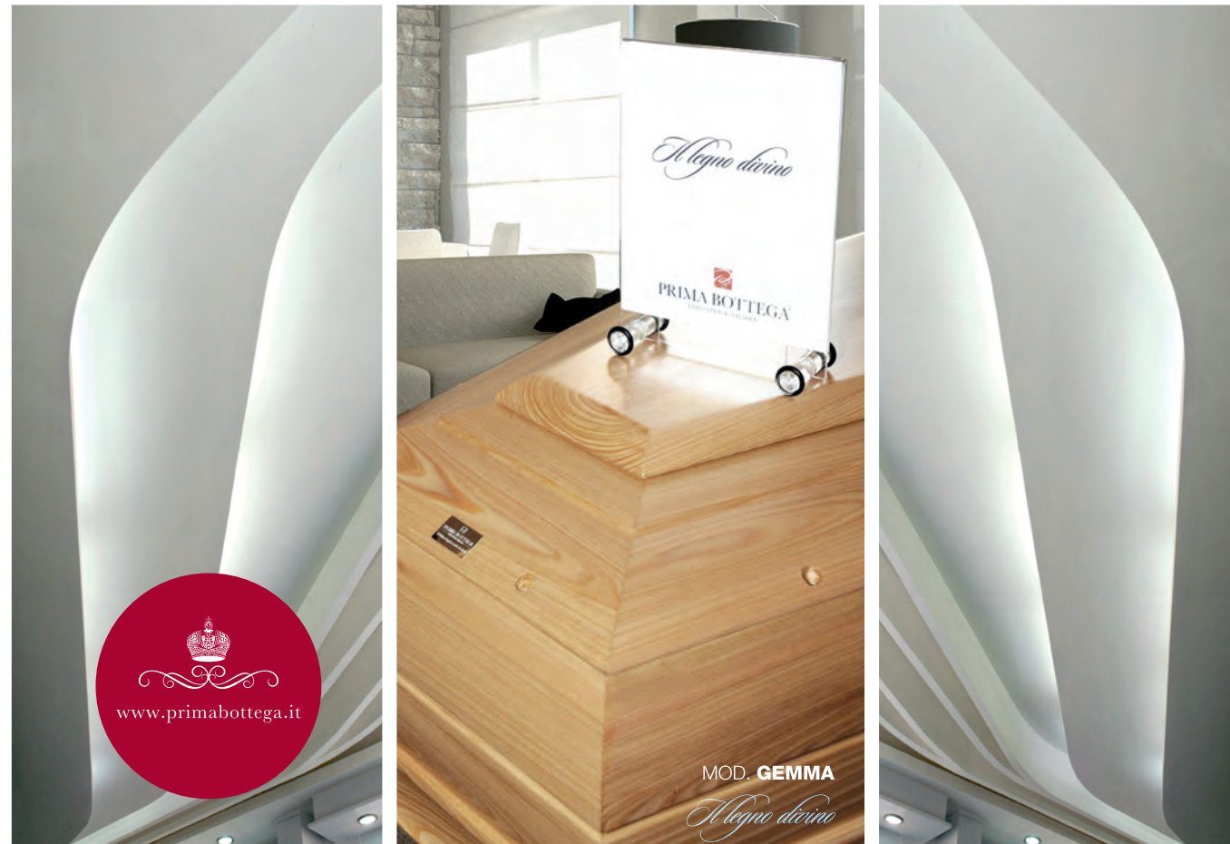
MOD. GEMMA Il legno divino