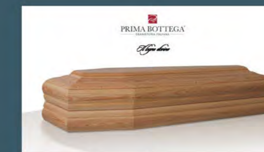
MOD. AURORA - Model AURORA

Our models were conceived from an idea and a particular vision of what coffin element signifies. Their particular process, detailed finishes and careful testing process ensure a unique product.