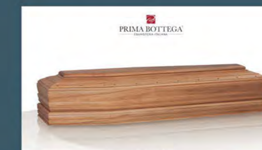
MOD. MADREPERLA - Model MOTHER PEARL