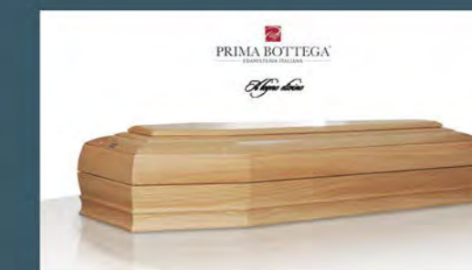
MOD. GEMMA - Model GEM