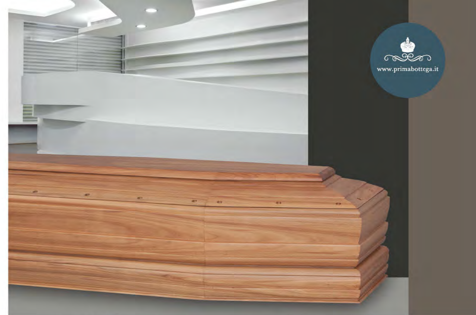
MOD. MADREPERLA - Model MOTHER PEARL

The cypress tree, the Tree of Life, has for centuries been considered the sacred wood par excellence: the biblical Noah's Ark, the original Holy Door of the Basilica of St. Peter and even the coffins of the Popes are a witness of this. This noble wood is characterized by a delicate and fresh fragrance and a natural resistance to all kind of alteration.