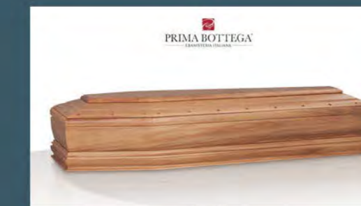
MOD. SCRIGNO - Model COFFER