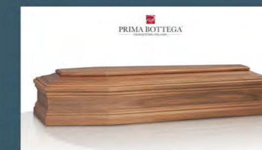
MOD. BRILLANTE - Model BRILLIANT