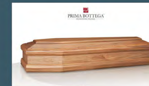
MOD. RUBINO - Model RUBY