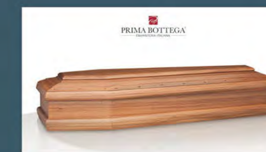
MOD. PERLA - Model PEARL