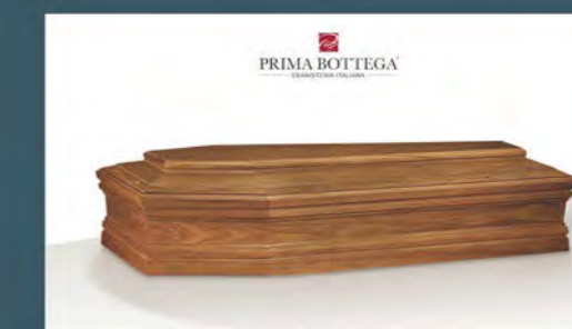
MOD. DIAMANTE - Model DIAMOND