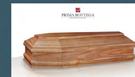
MOD. CORALLO - modello fuori misura Model CORAL - model oversized