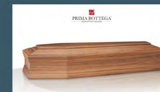
MOD. ONICE - Model ONYX