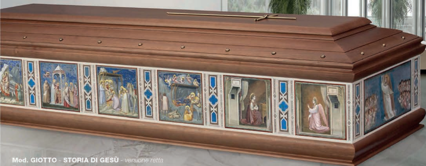
Mod. GIOTTO - STORIA DI GESÙ - versione retta Foto in basso: Particolari di urne Affresco in tecnica mista.