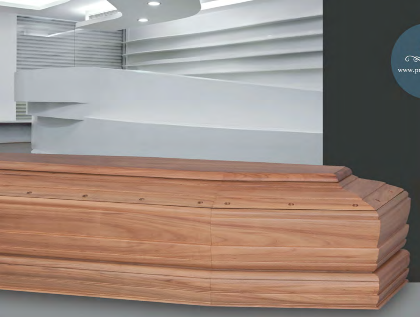
MOD. MADREPERLA - Model MOTHER PEARL

Il Noce Extra GRANDE QUALITÀ PICCOLO PREZZO/ GREAT QUALITY SMALL PRICE