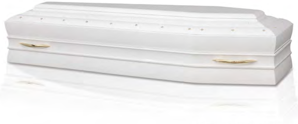
Versione spallata in Noce Americano Extra laccatura bianca con maniglie