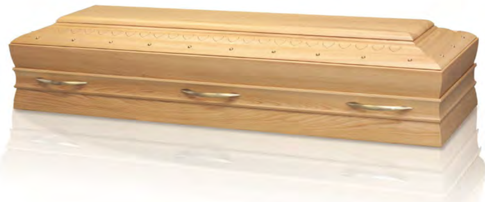
Versione retta in Cipresso Superior finitura satinata con maniglie