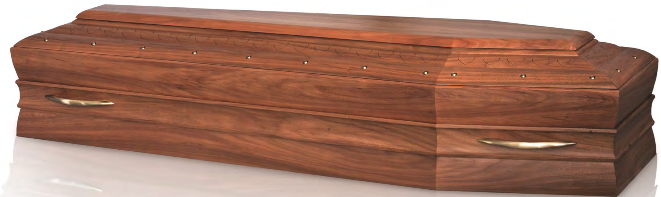
KÖRPERFORM - Nussbaum Extra, Matte Fertigung