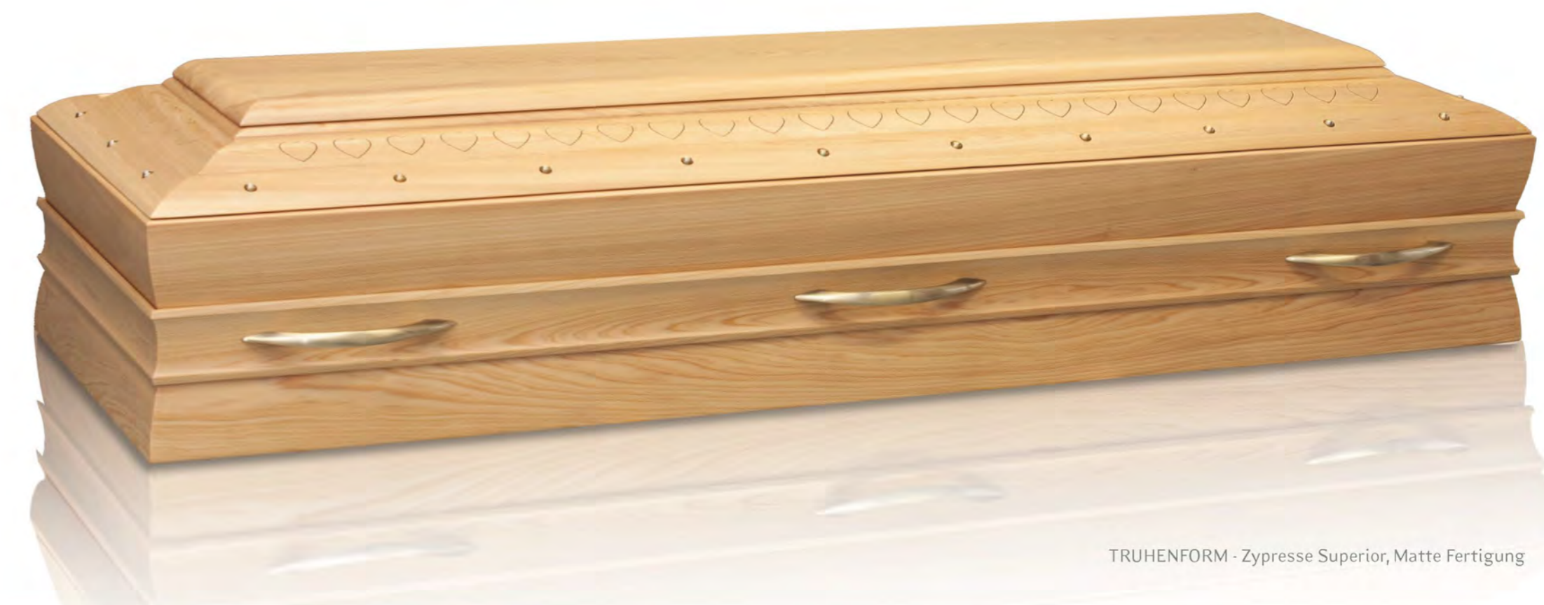
TRUHENFORM - Zypresse Superior, Matte Fertigung