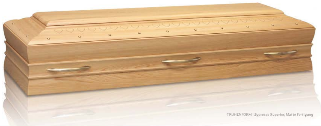
TRUHENFORM - Zypresse Superior, Matte Fertigung