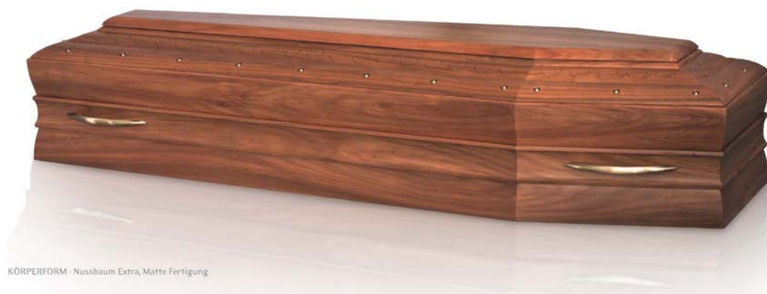
KÖRPERFORM - Nussbaum Extra, Matte Fertigung