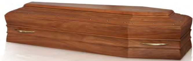
Versione spallata in Noce Extra finitura satinata con maniglie