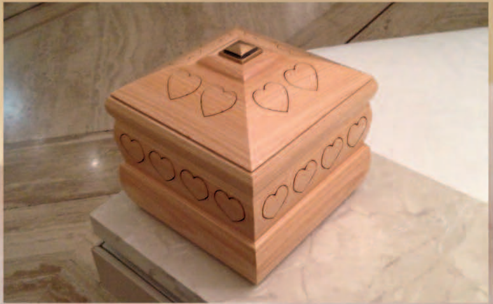
Una nuova creazione: l'urna Scigno del Cuore.