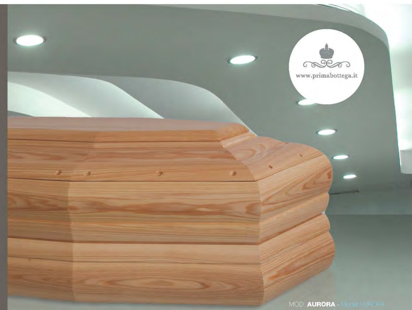
MOD. AURORA - Model AURORA

del grande artigianato e lo sguardo volto alla contemporaneità del design. L'attenzione e la cura riposte nella sua realizzazione si esprimono attraverso l'uso di materie prime di eccellenza, l'artigianalità delle lavorazioni, eseguite esclusivamente in Italia, e un meticoloso controllo di qualità lungo l'intero processo produttivo.