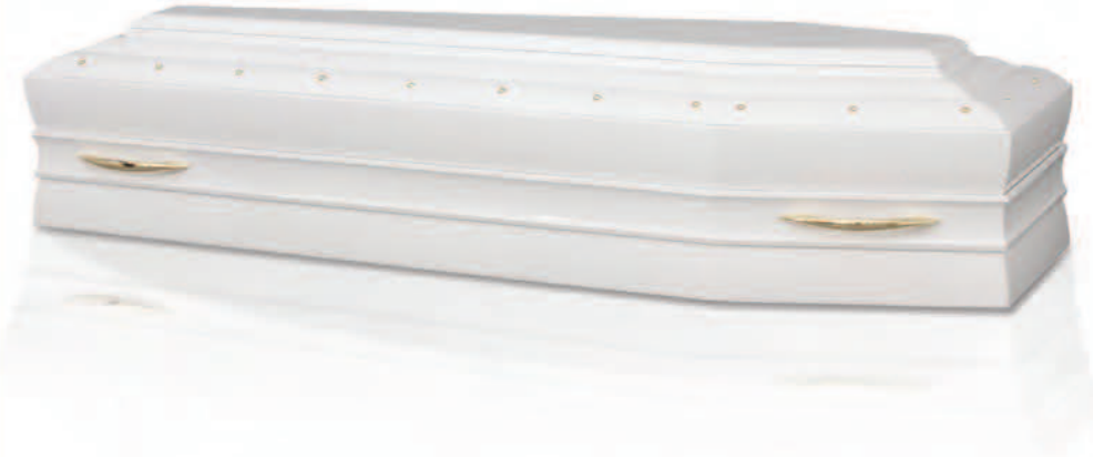
Versione spallata in Noce Americano Extra laccatura bianca con maniglie