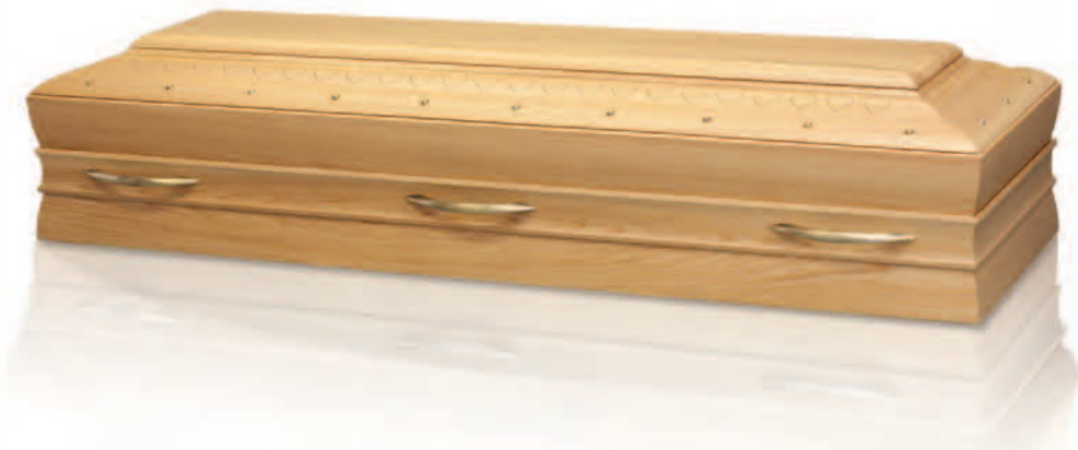
Versione retta in Cipresso Superior finitura satinata con maniglie