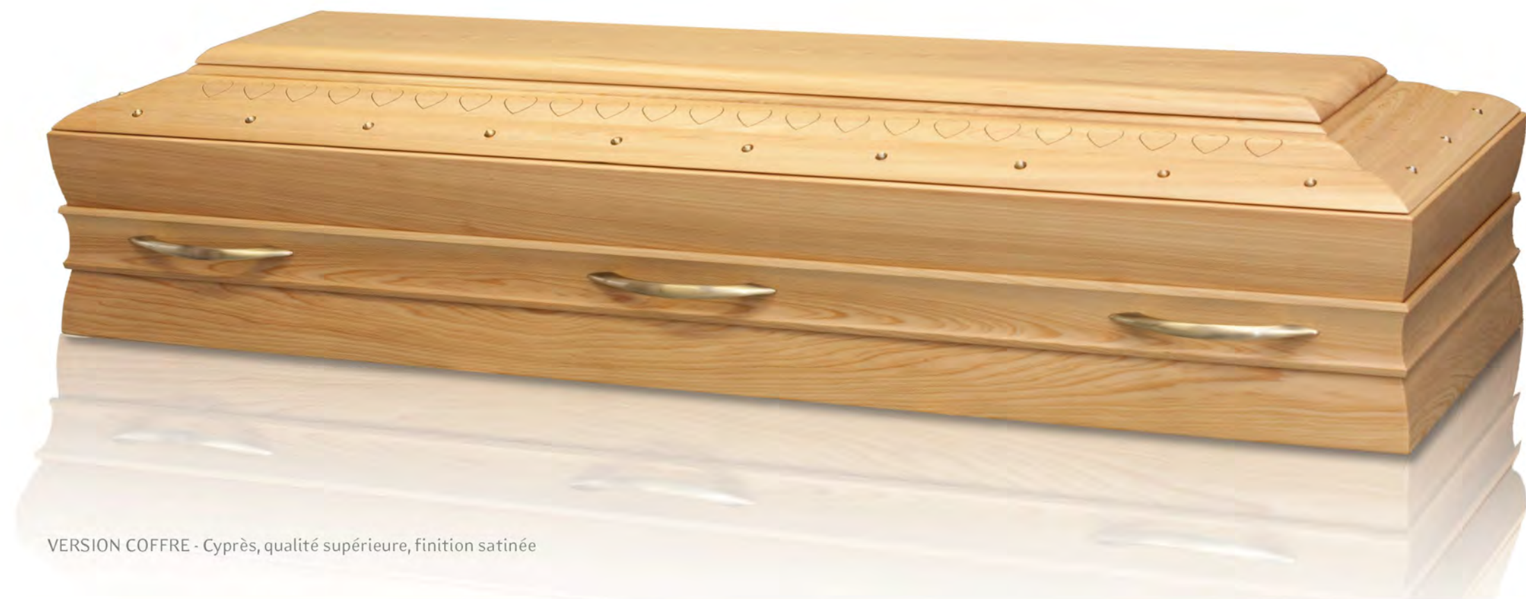
VERSION COFFRE - Cyprès, qualité supérieure, finition satinée