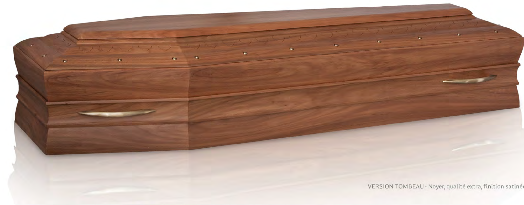
VERSION TOMBEAU - Noyer, qualité extra, finition satinée